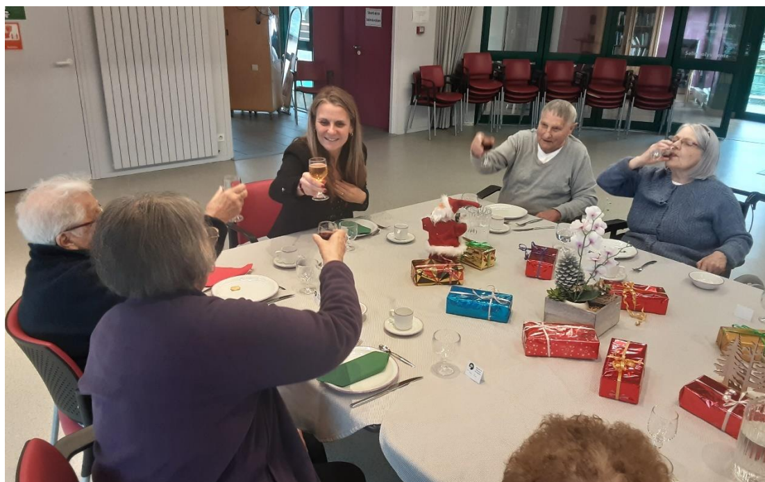
18 décembre 2025 - Déjeuner de bienvenue