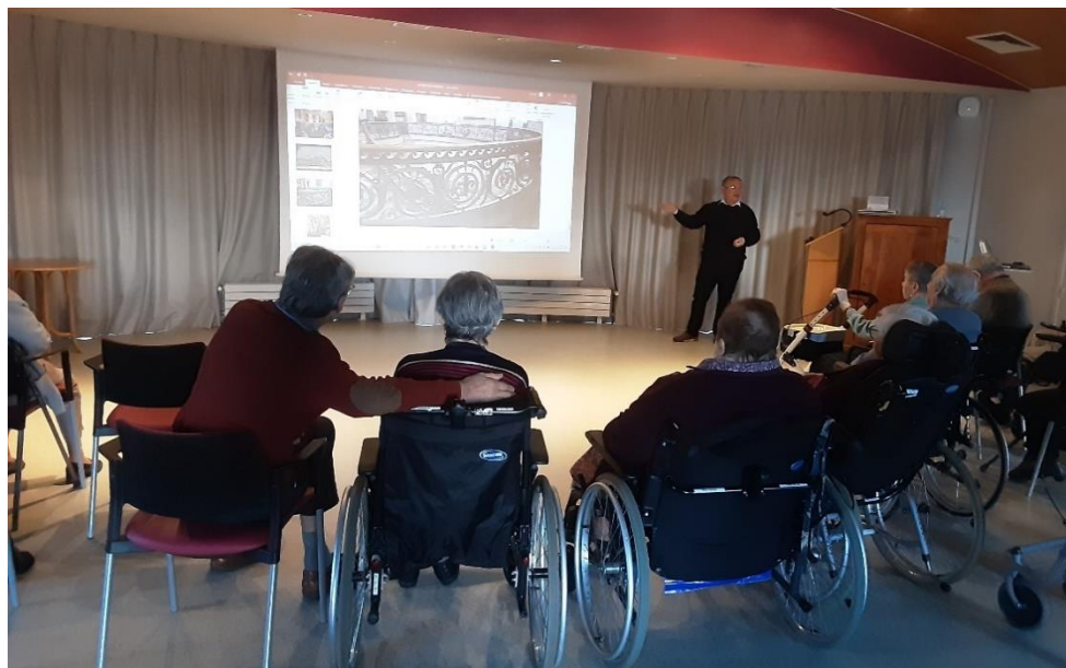
20 novembre 2025 - Diaporama sur le château de Chantilly par Mr Le Gall