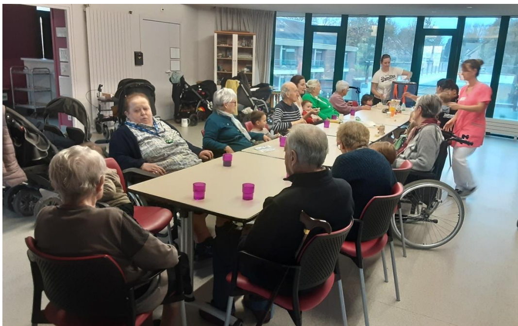
13 novembre 2025 - Visite de la micro-crèche de Plélan