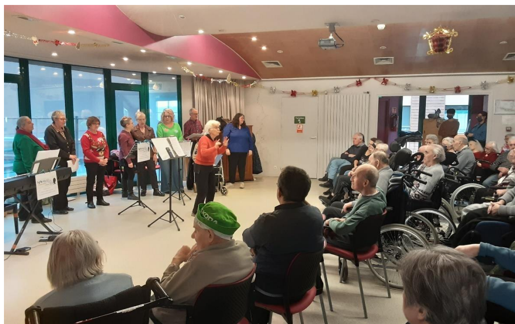
17 décembre 2025 - Chorale TréFaSiLa de Tréffendel