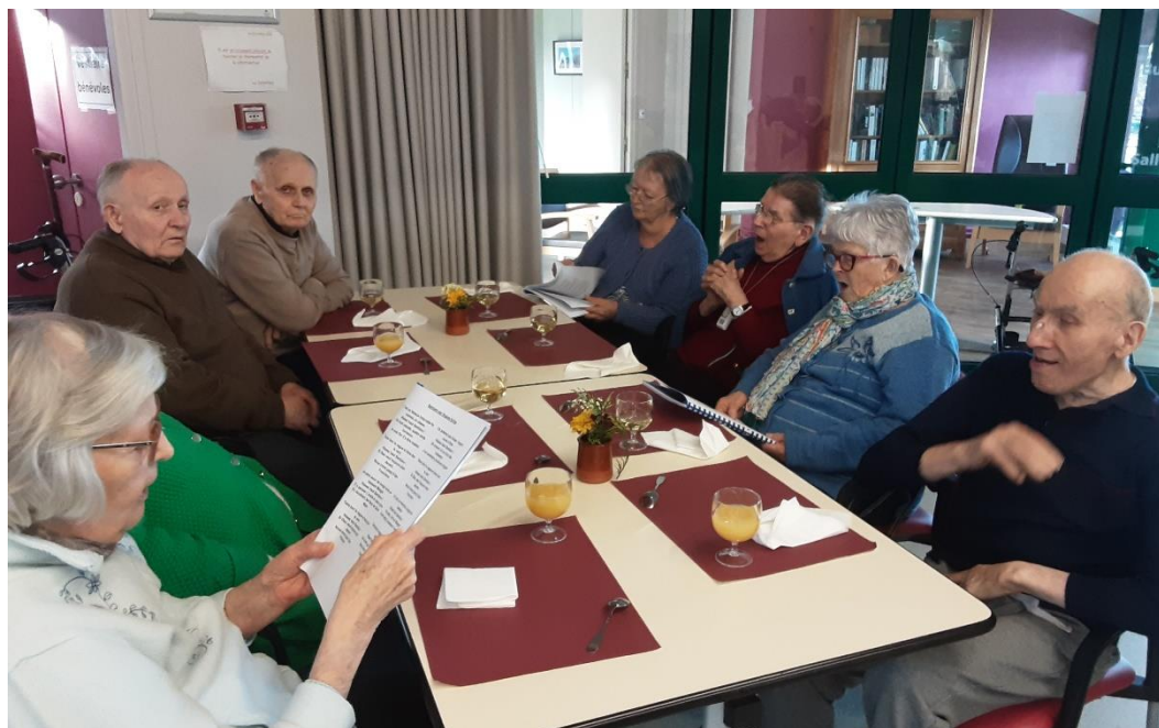
10 décembre 2025 - Fête des anniversaires du mois de décembre