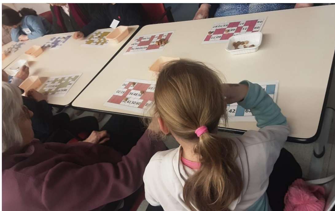
1er décembre 2025 - Loto avec les élèves de l'école Notre- Dame