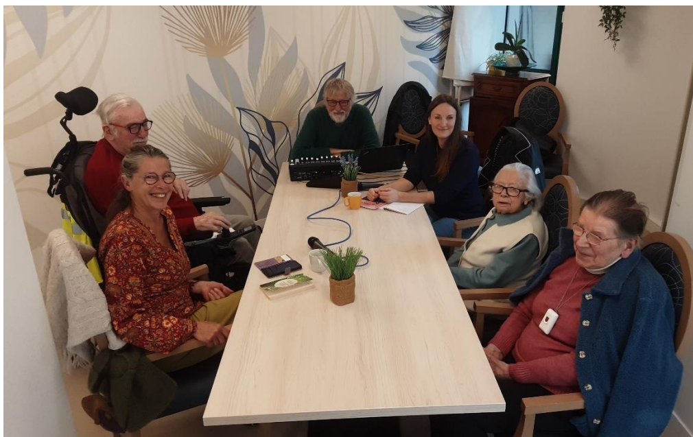
05 novembre 2025 - Enregistrement d'une émission pour la radio Timbre FM de Augan