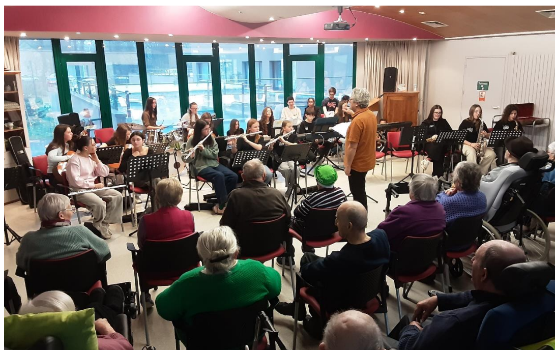
11 décembre 2025 - Orchestre du collège de Plélan