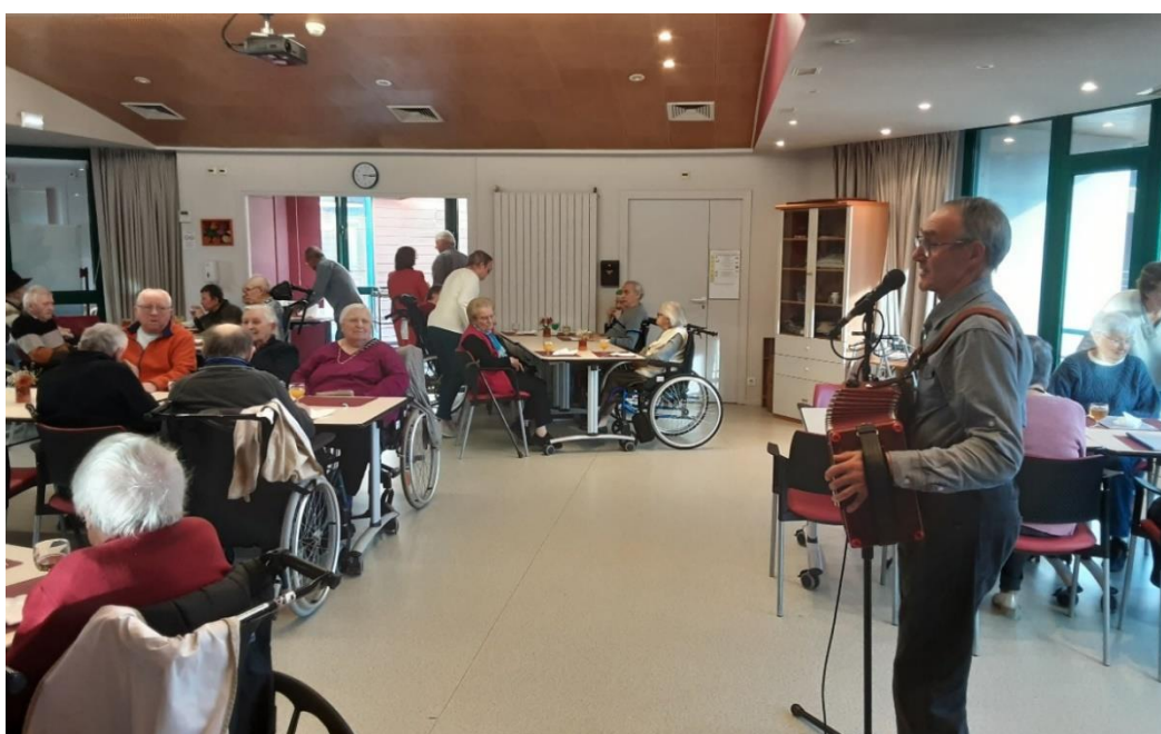
19 novembre 2025 - Fête des anniversaires avec le p'tit fermier